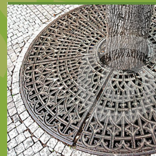
CIRCULAR COM PROTEÇÃO