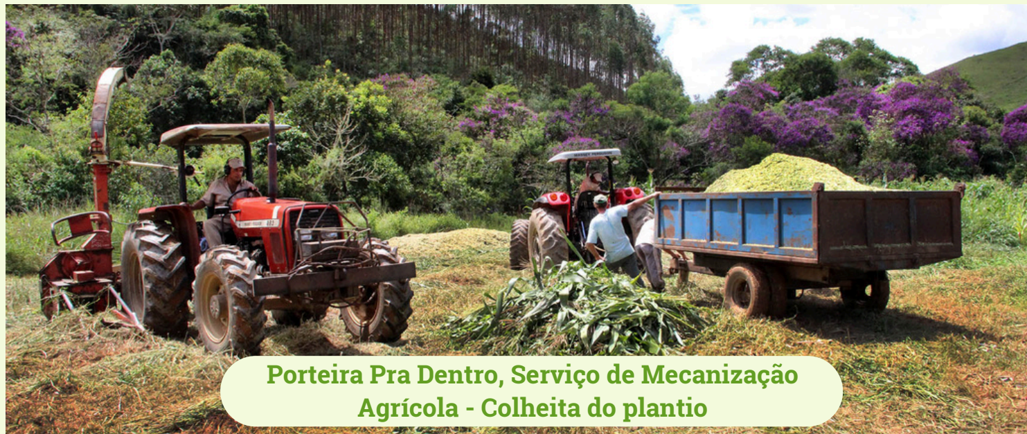
Porteira Pra Dentro, Serviço de Mecanização Agrícola - Colheita do plantio