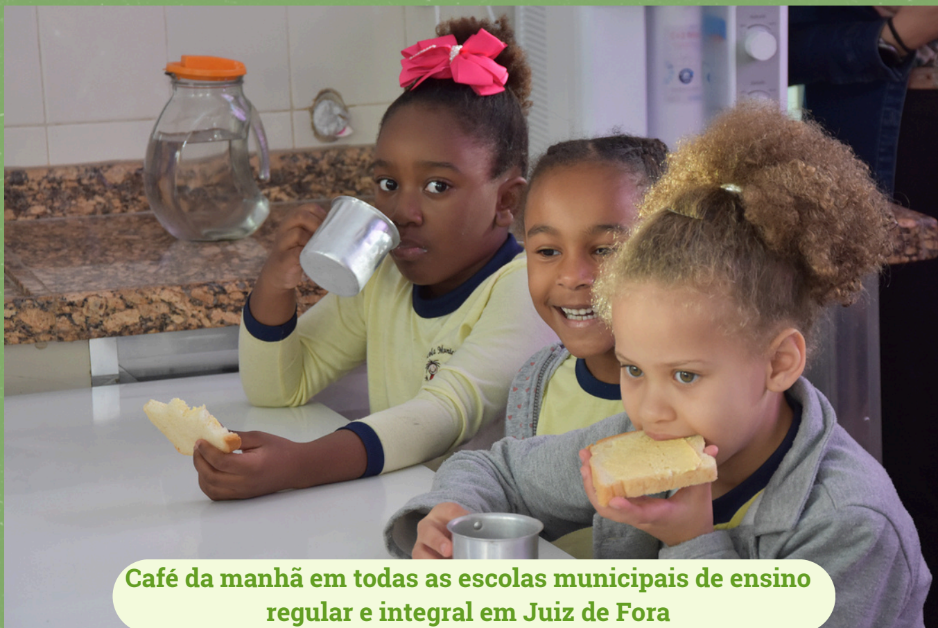
Café da manhã em todas as escolas municipais de ensino regular e integral em Juiz de Fora