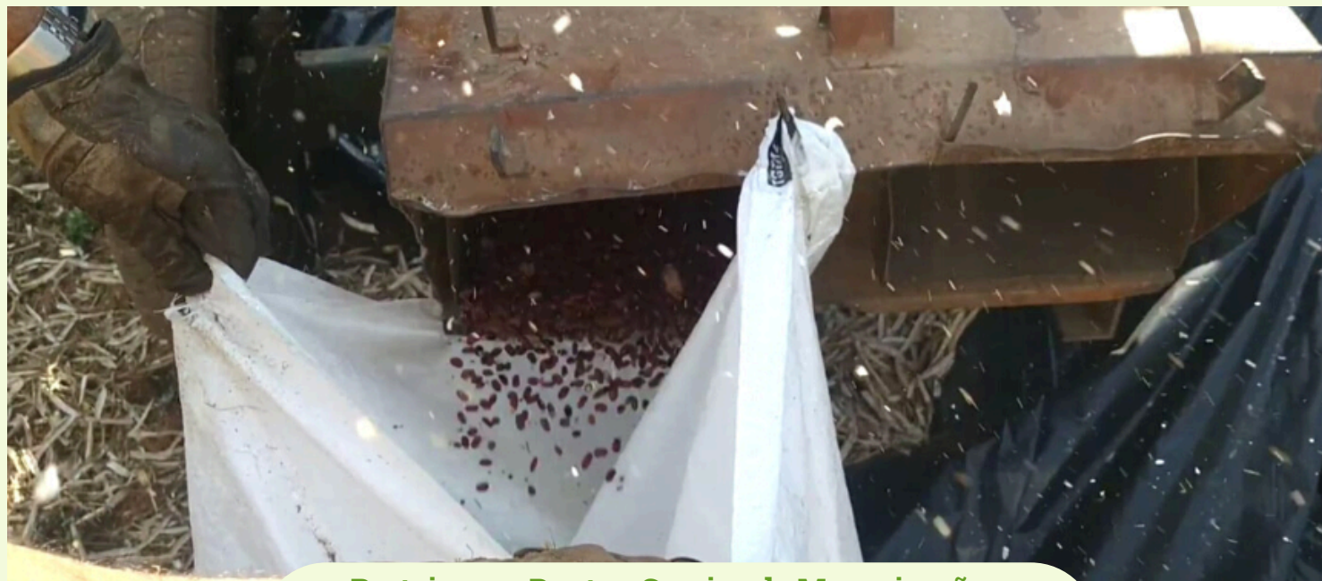
Porteira pra Dentro, Serviço de Mecanização Agrícola - Beneficiamento de feijão e preparo do solo para plantio