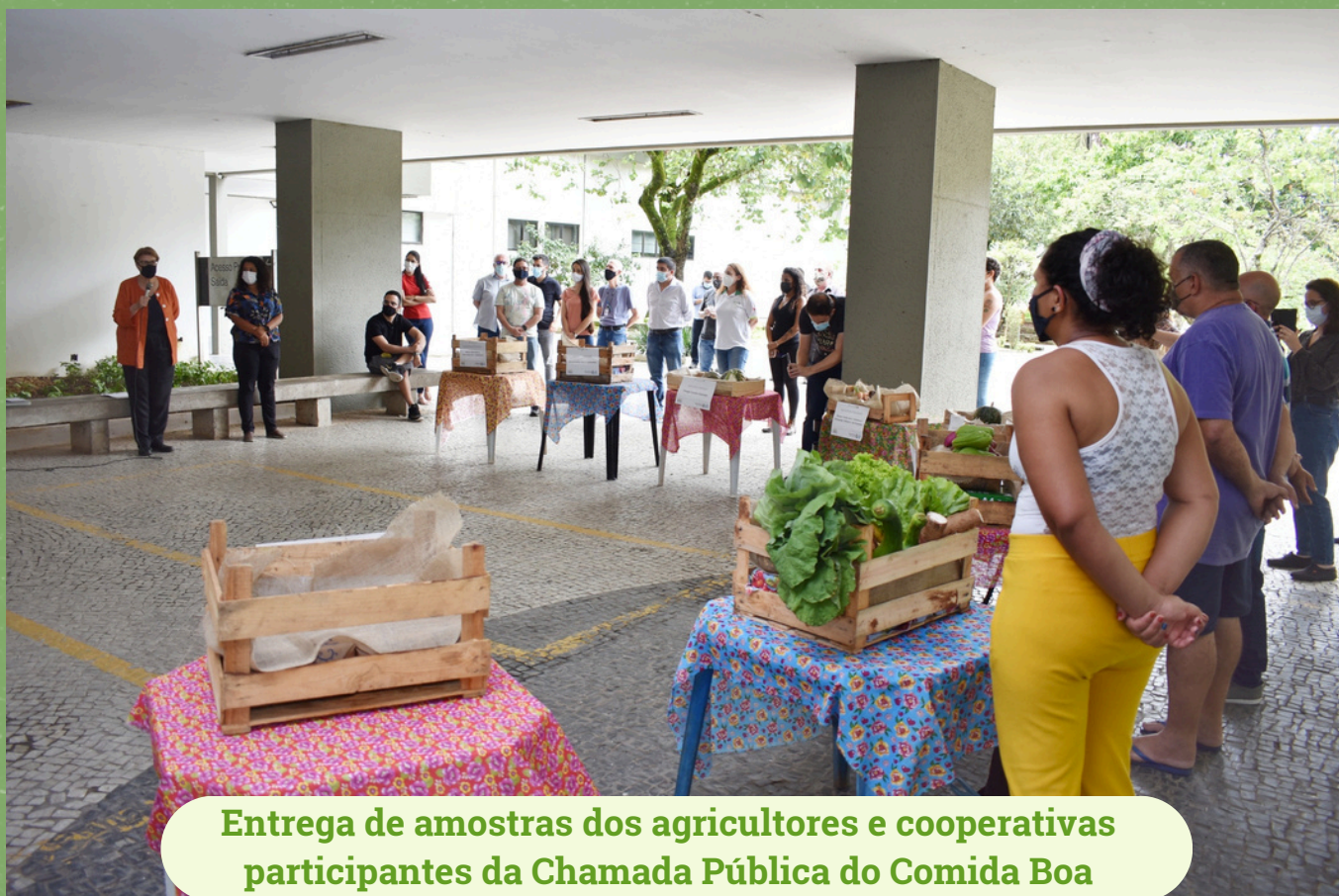
Entrega de amostras dos agricultores e cooperativas participantes da Chamada Pública do Comida Boa