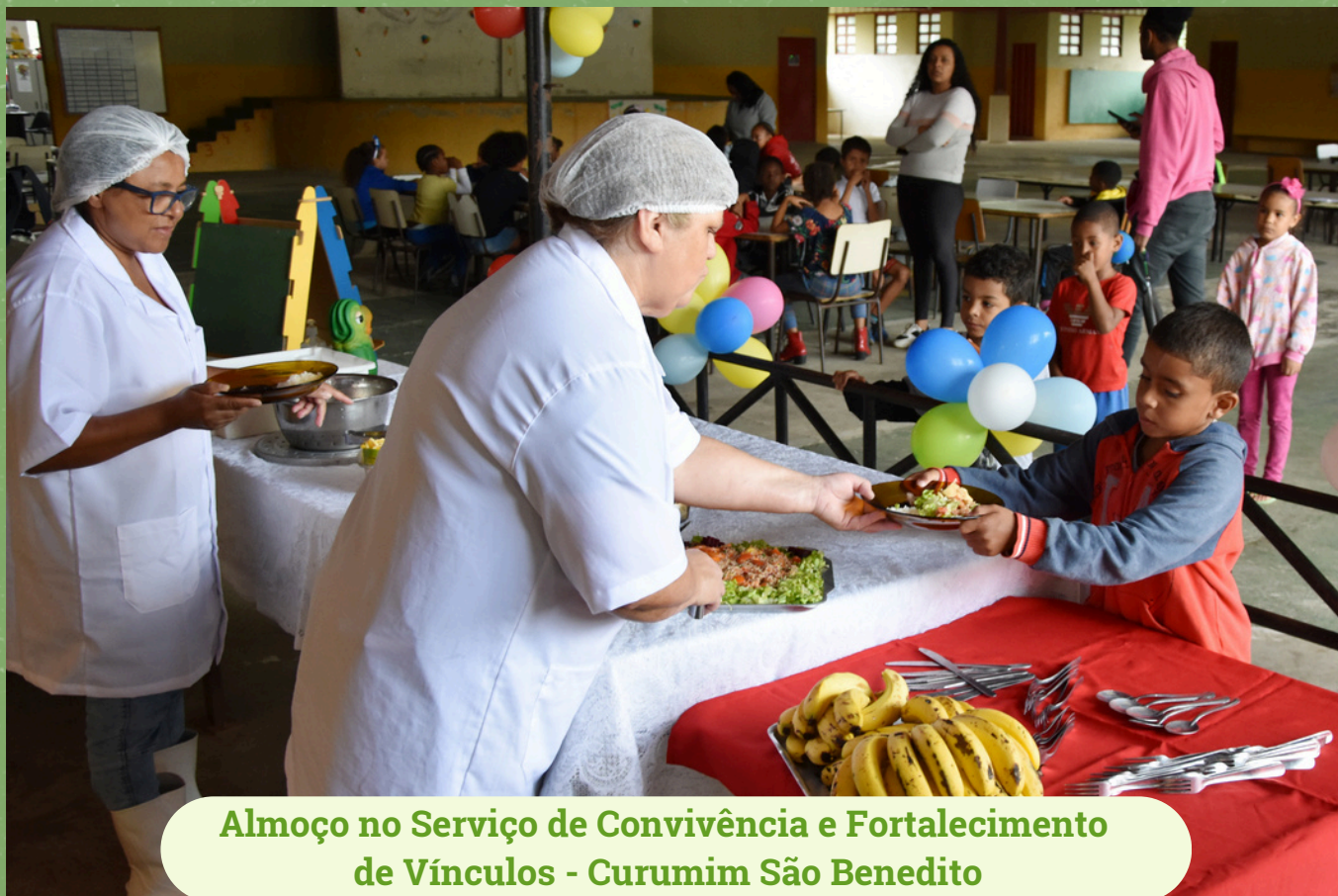
Almoço no Serviço de Convivência e Fortalecimento de Vínculos - Curumim São Benedito