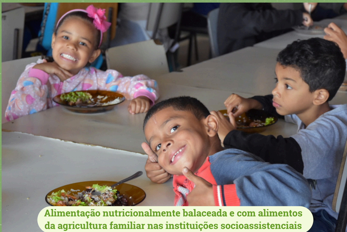
Alimentação nutricionalmente balanceada e com alimentos da agricultura familiar nas instituições socioassistenciais