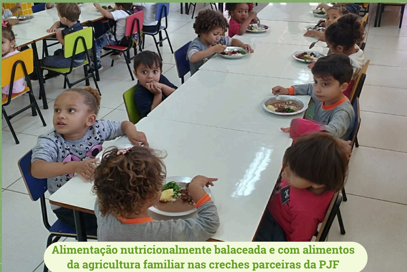
Alimentação nutricionalmente balanceada e com alimentos da agricultura familiar nas creches parceiras da PJJ