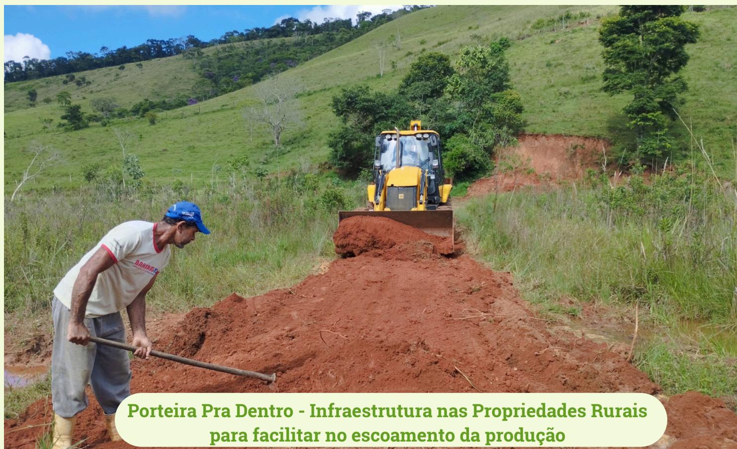
Porteira Pra Dentro - Infraestrutura nas Propriedades Rurais para facilitar no escoamento da produção