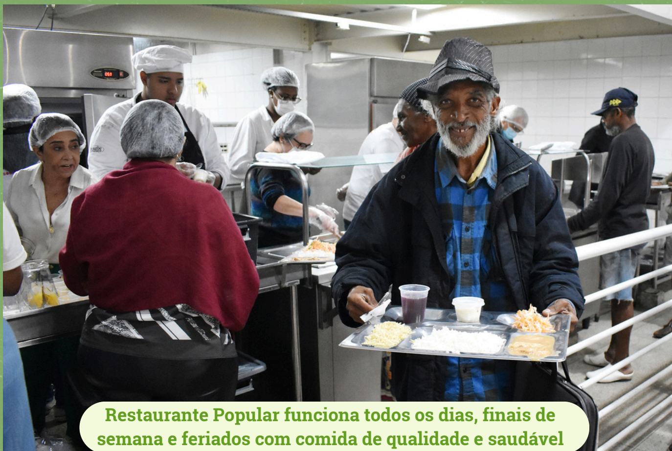
Restaurante Popular funciona todos os dias, finais de semana e feriados com comida de qualidade e saudável