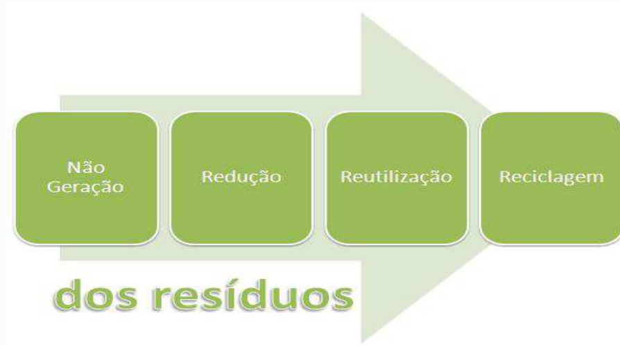
Figura 1. Prioridade dos programas e ações de educação ambiental